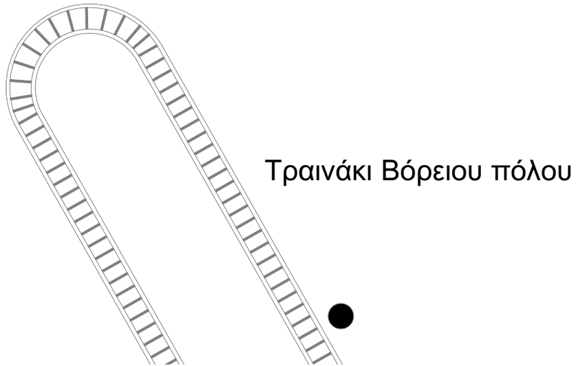
Τραϊνάκι Βόρειου πόλου