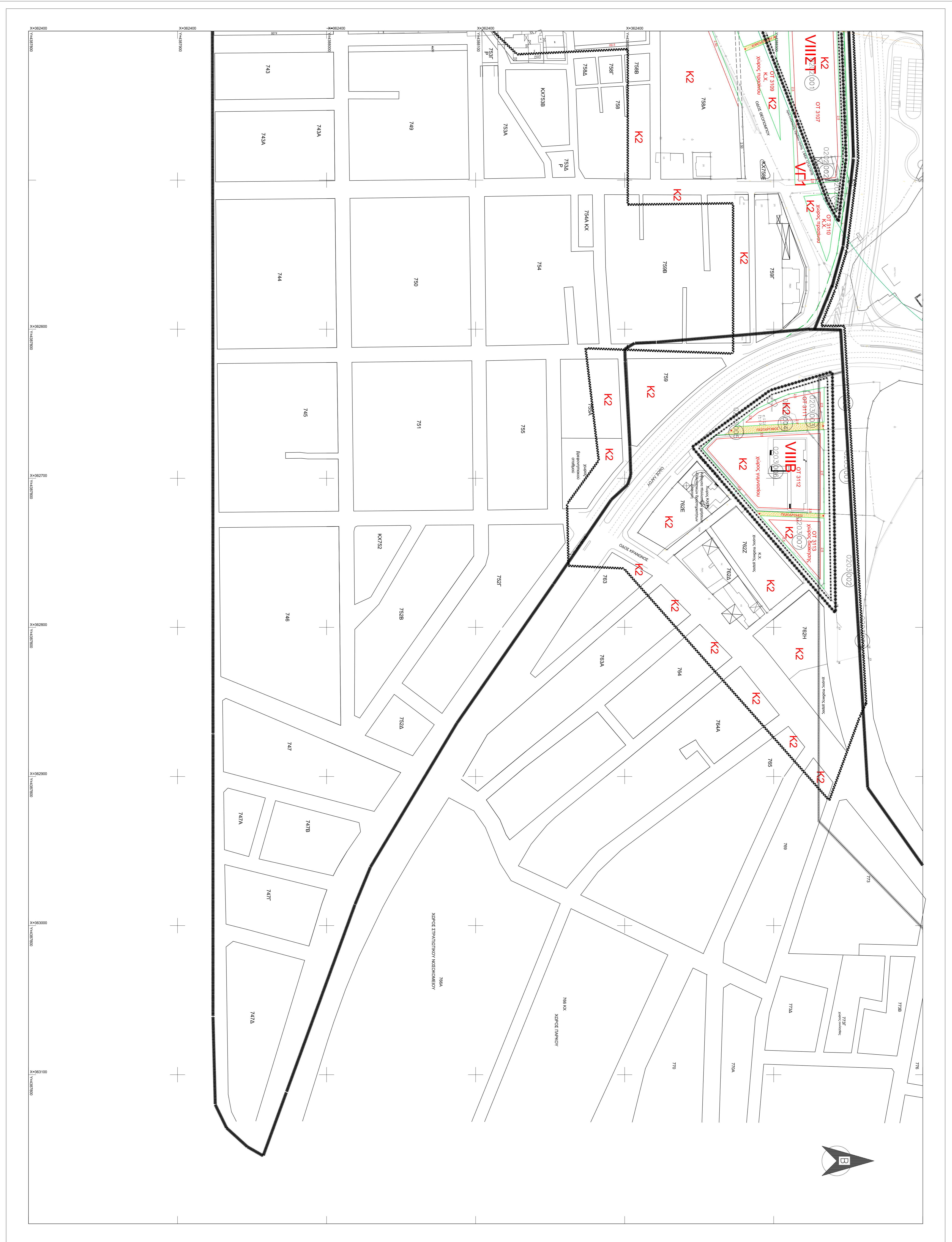
ΔΙΑΓΡΑΜΜΑ ΣΥΜΒΕΤΗΣ ΘΥΛΙΩΝ